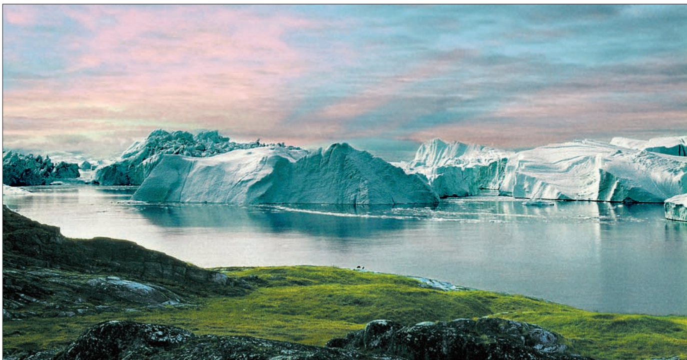
Både USA og Sovietunionen har indsamlet store mængder bathymetriske data fra Polarhavet ved hjælp af ubåde

Af Louise Halkjær og Steen Laursen, GeologiskNyt