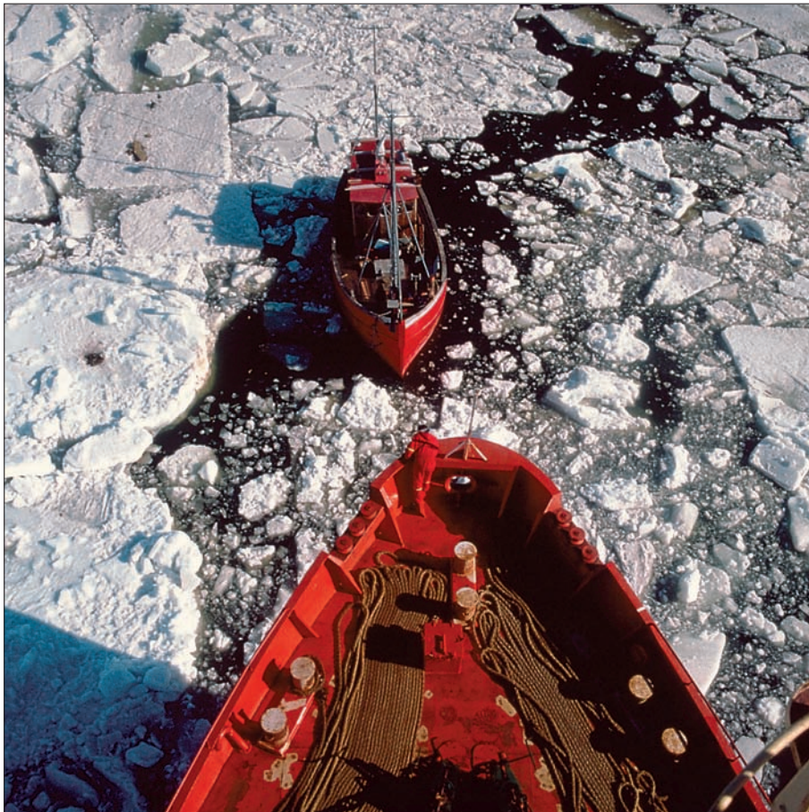
De ekstreme vejrforhold i Polarhavet gør, at området geologisk set er et næsten udforsket område.

Måske kan man få Canada med i et samarbejde om et fælles projekt og deles om udgifterne. De har også interesser i området nord for Grønland og vil snart gå i gang med at indsamle data. Der er endnu ingen aftale om, hvor grænsen mellem de danske og canadiske krav skal gå, men Christian