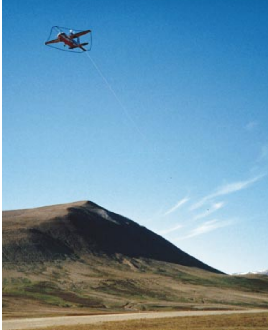
Fig.2 Et geofysisk målefly i luften over Constable Pynt, Østgrønland, i august 1997 (AEM Greenland 1997). Mange forskellige fly anvendes til flybåren geofysik. Her er det et CASA fly med den elektromagnetiske sender på flyet og to målesonder (små sorte prikker på billedet) hængende i kabler under og efter flyet. Flyet befinder sig i den sædvanlige målehøjde for denne type af opmåling, ca. 120 meter over terrænet, mens de to sonder befinder sig ca. 50 – 60 meter over terrænet.

Flybårne elektromagnetiske metoder omfatter et antal forskellige metoder, der alle baserer sig på den reaktion (sekundærfeltet), som undergrundens bjergarter udviser på kunstigt skabte elektromagnetiske felter (primærfeltet). Primærfeltet udsendes af spoler på flyet og sekundærfeltet måles af sensorer, der som regel hænger under og efter flyet, se fig. 2. De mest almindelige mineraler som f.eks. kvarts og feldspat er meget dårlige elektriske ledere og vil derfor ikke medvirke til dannelsen af sekundærfelter; de er gennemsigtige for metoden. Mange typer af blandt andet malmmineraler er derimod gode ledere og viser deres tilste-