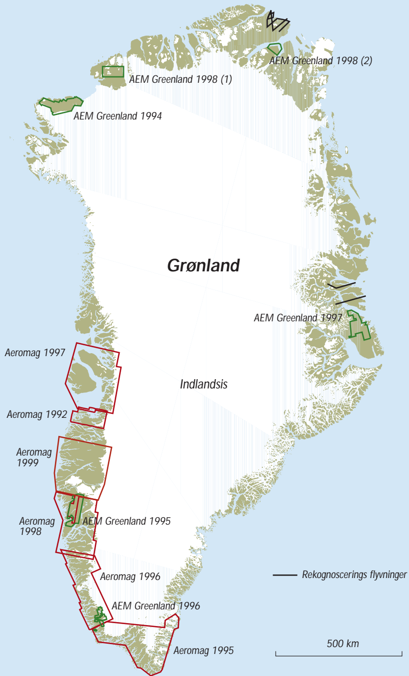
Fig.1 Kort over Grønland der viser de aeromagnetiske (Aeromag) og elektromagnetiske (AEM Greenland) opmålinger gennemført i Grønland 1992 – 1999.