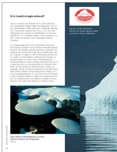
Bogens side 80.

Bogens fotografier er et kapitel for sig. Den fotografiske gengivelse af mineralerne grænser til det sublime og byder læseren på en æstetisk oplevelse langt ud over det vanlige. De talrige og enestående smukke farvebilleder i stort format viser hvad der er bogens vigtigste ærinde: at åbne læserens øjne for den skønhed der ligger gemt i naturen. For mineral-samleren, smykkekestensentusiast eller ingeniøren med teknisk interes-