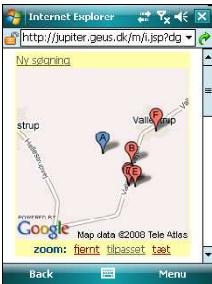
Fig. 1: Søgeresultat

Med en mobiltelefon og en browser kan du med få klik fremsøge boringer. Du angiver blot boringens unikke ID eller en nærliggende adresse og relevante boringer vises på et kort. Brug af GPS til søgninger er under udvikling.