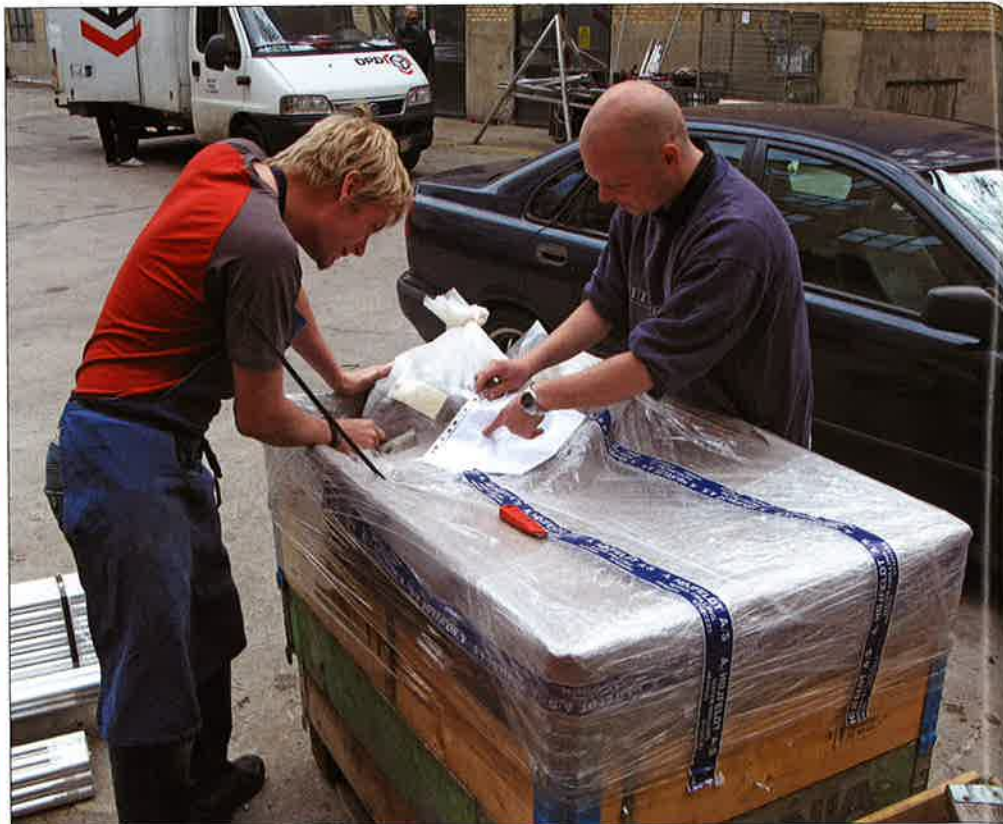
Forbilledlig prøveforsendelse! Prøverne ankommer til GEUS på en palle med klapprammer og vandtæt låg. Alle prøver er puttet i poser, hvor de officielle klistermærker tydeligt viser posenumrene. Prøverne fra den enkelte boring er samlet i én eller flere kraftige plastposer påført mærkater med lokalitet og DGU-nummer. Vedlagt findes en liste over forsendelsens indhold. Boringerne er desuden indberettet med PC-jupiter, der er brøndborerens mulighed for at lave den lovpligtige indberetning digitalt.

I dag foregår samarbejdet anderledes godt og gnidningsfrit. Boreprøvelaboratoriet