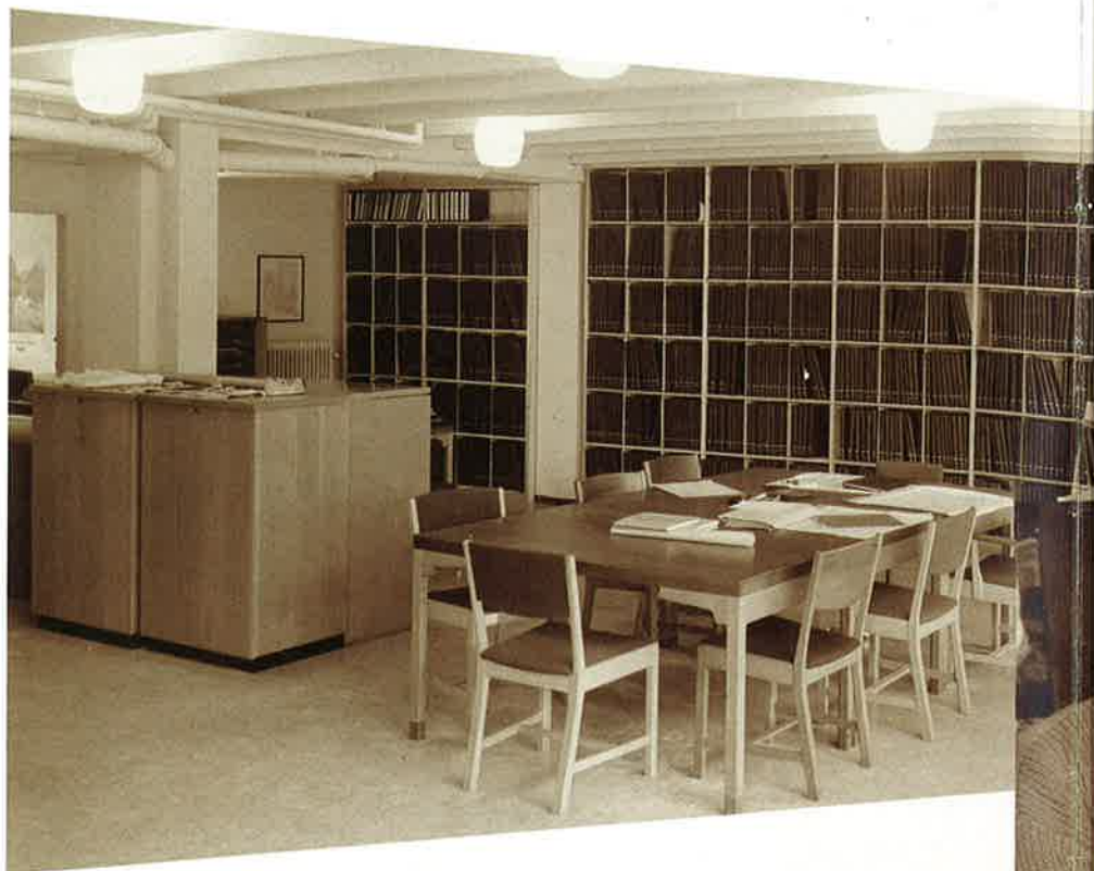
Billede fra 1970erne af borearkivet på Thoravej 33. På hyldeerne står sorte springbind, der rummer de rentegnede boreprofiler fra vandforsyningsboringer. I skabene opbevares kortene, hvor boringernes beliggenhed er afsat med en prik og med DGU arkivnummer.

"Ved Udførelsen af Boringer, der anbringes i Vandindvindingsøjemed, skal den, der lader Boringen udføre, til Danmarks Geologiske Undersøgelse indsende Meddelelse om Boringens Beliggenhed, de forefundne Jordlag, Vandstanden og Resultatet af afholdte Prøvepumpninger".