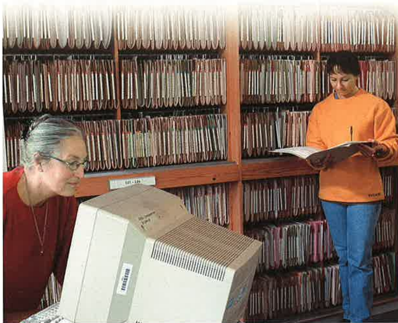
Billede fra Borearkivet på Thora-vej 8 med to af afdelingens medarbejdere. I baggrunden arkivskabe med hængemapper, hvor originalpapirerne om boringerne opbevares.

Atlasblade og målebordsblade udgik af Kort og Matrikelstyrelsen (tidligere Geodætisk Institut) sortiment omkring 1970, men GEUS har opretholdt atlasbladinddelingen for at undgå at skulle lave nummere-